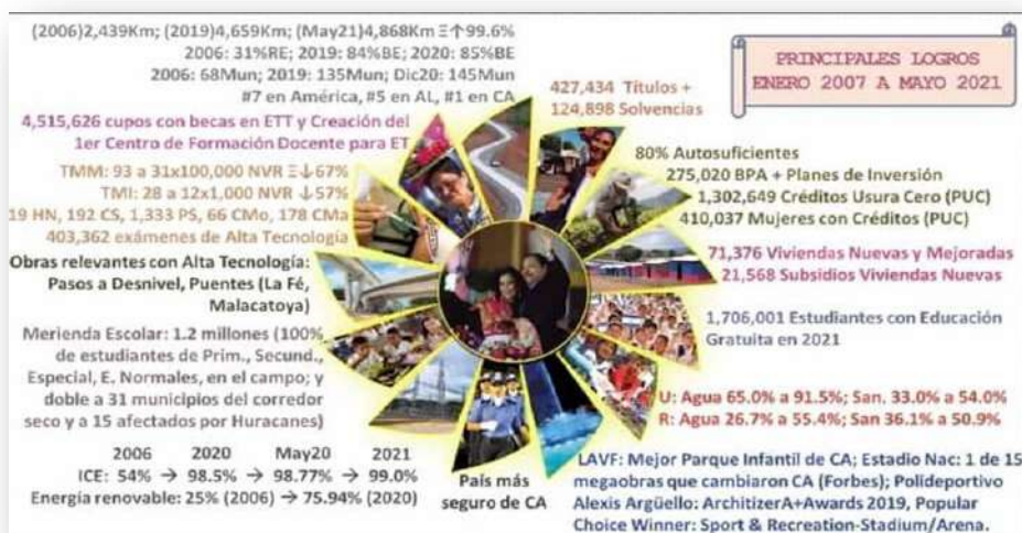
Gráfica 2: Principales resultados de los Planes de lucha contra la pobreza y fomento del desarrollo humano en Nicaragua.