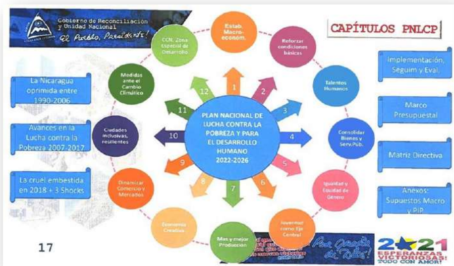
Gráfica 1: Principales lineamientos del Plan Nacional de lucha contra la pobreza, para el desarrollo humano 2022-2026.