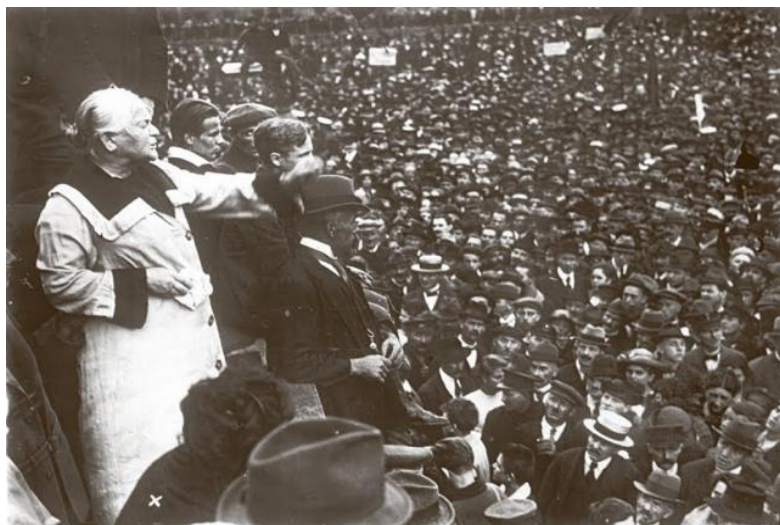
Imagen del sitio web de Granma

Cada movimiento tiene su tradición e historia. Al movimiento de las luchas por la reivindicación de los derechos de las mujeres pertenece entre muchas otras la comunista alemana, Clara Zetkin. Aunque la figura más sobresaliente dentro del movimiento obrero y de los precursores del Partido Comunista, es por supuesto Rosa Luxemburgo, nos urge en este lugar presentar otra camarada que no queda atrás y eso es Clara Zetkin. Ella ha sido miembro fundador del Partido Comunista alemana, así como luchadora importante para la igualdad de las mujeres en la época del cambio del siglo XIX/XX. Si nosotros conmemoramos a las mujeres precursoras de la revolución, allí ella debe ocupar un espacio preponderante, porque era una de las más significantes representantes del movimiento obrero en Alemania del cambio de siglo. Dedicó toda su vida a la organización de las mujeres trabajadoras, fue fundadora de la Segunda Internacional y opositora a la dirección socialdemócrata cuando esta apoyó al rearmamento para la Primera Guerra Mundial.