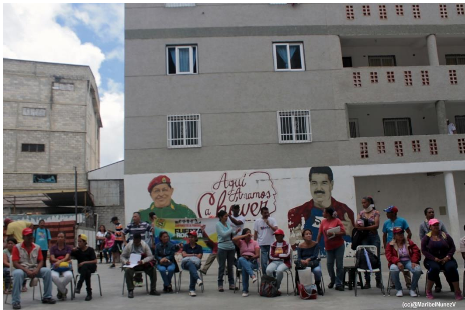
Imagen propia de Maribel Nuñez

“CUANDO SE TRATA DE TI Algo sucede en mi pecho El mar se abate en mis ojos, Eterno Abrazo tu sueño De patria De mujer De niño De obrero De razas De pan De cielo De agua De libros De sur De besos Comandante tu pueblo parirá el sueño”