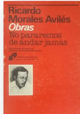
Retrato del Comandante Ricardo Morales Avilés Portada del libro Obras. No pararemos de andar jamás