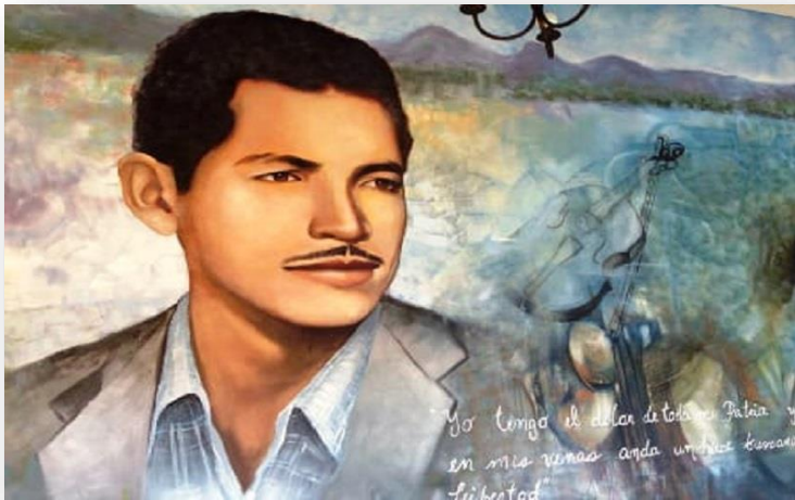
Mural conmemorativo dedicado a Rigoberto López Pérez en León

Vistiendo los colores de la patria y revestido por sentires de indignación, justicia social y libertad, el 21 de septiembre de 1956 Rigoberto López Pérez inició con audacia, coraje y conciencia nacional, el proyecto emancipador más desafiante en términos de acción para iniciar el principio del fin de la dictadura somocista: el ajusticiamiento del tirano Anastasio Somoza García.