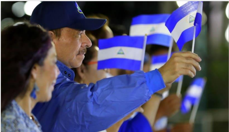
Comandante Daniel y Compañera Rosario en el Desfile patrio 2022

Compartimos con nuestros lectores algunas frases destacadas del discurso que el Comandante Daniel pronunció en Managua, el 14 de septiembre de 2022, en el Desfile Patrio en Conmemoración del 166 Aniversario de la Batalla de San Jacinto y el 201 de la Independencia de Centroamérica