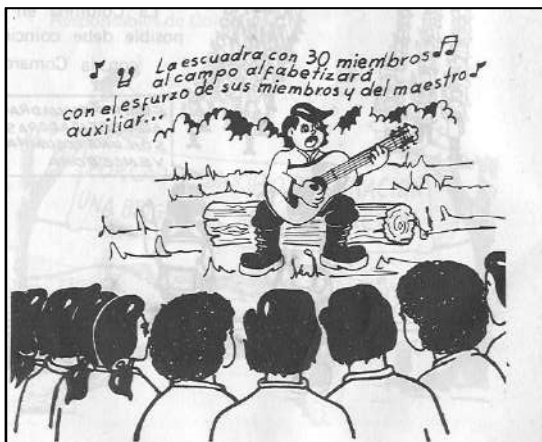
Manual del brigadista

En la justificación del proyecto, se establecía como indispensable la formación de un archivo o museo con la misión fundamental de conservar, para las generaciones venideras, la riqueza de la lucha sandinista los testimonios. Sobre este aspecto nos enfocaremos posteriormente.