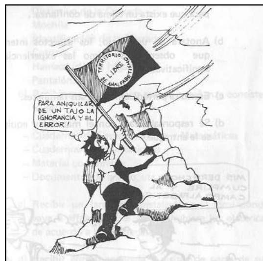
Manual del brigadista

Posteriormente, tras la derrota del FSLN en febrero de 1990 y la asunción del poder por parte del primer gobierno neoliberal encabezado por Violeta Barrios de Chamorro, el IHN fue trasladado a la ahora extinta Universidad Centroamericana (UCA) integrándose con el centro conocido como Instituto Histórico Centroamericano (IHCA), Instituto formado en los años 30 del siglo XX y que tenía como misión fundamental la custodia del patrimonio documental de la Compañía de Jesús. La fusión de ambos dio lugar a la formación del Instituto de Historia de Nicaragua y Centroamérica.