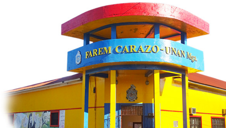
FAREM-Carazo, formando profesionales desde el año 1991

La FAREM-Carazo por medio de sus Departamentos Académicos oferta las Carreras en modalidades regular, profesionalización, dominical, así como los programas especiales suscritos como SINACAM y