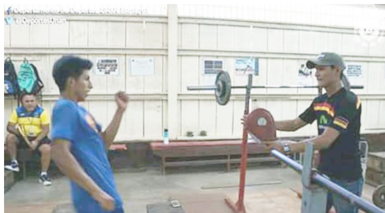
FAREM-Carazo se enorgullece con nuevo talento deportivo

Actualmente se encuentra asistiendo a las prácticas junto a estudiantes seleccionados de las otras Facultades de UNAN-Managua, por su esfuerzo, humildad y dedicación es un orgullo de la FAREM-Carazo.