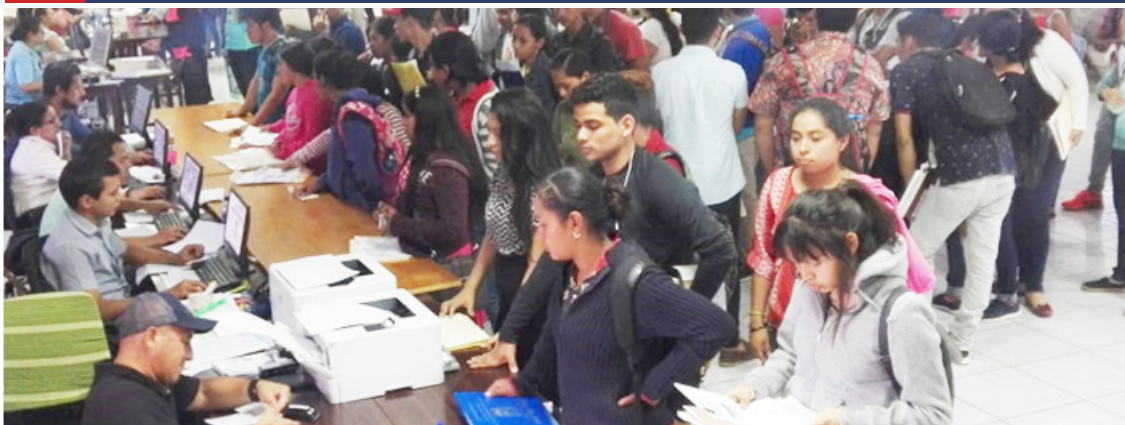
Personal docente y administrativo acompaña a jóvenes en el proceso de prematrículas

El período de pre matrículas efectuado del 21 al 25 de enero del 2019 en el Auditorio “Eliseo Carranza” de la Facultad Regional Multidisciplinaria de Carazo, se realizó con mucho orden y afluencia notoria. En esta Facultad se le brinda prioridad a los aspirantes procedentes de la IV Región del país.