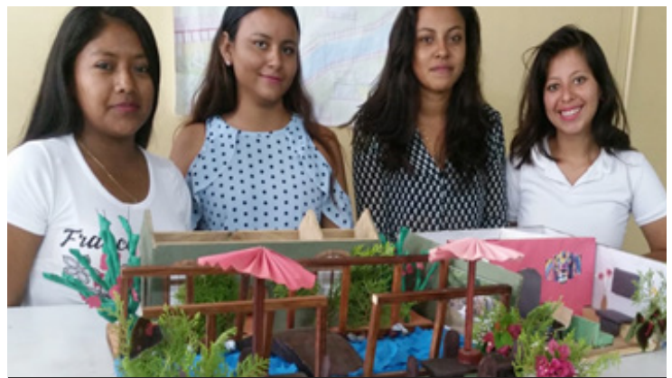
Estudiantes demostraron destrezas en innovación y reciclaje

Esta presentación de Proyectos de Alojamiento, fue realizada con el fin de poner en práctica los conocimientos técnicos adquiridos en la asignatura de Gerencia Hotelera en cuanto durante el II semestre del 2018.