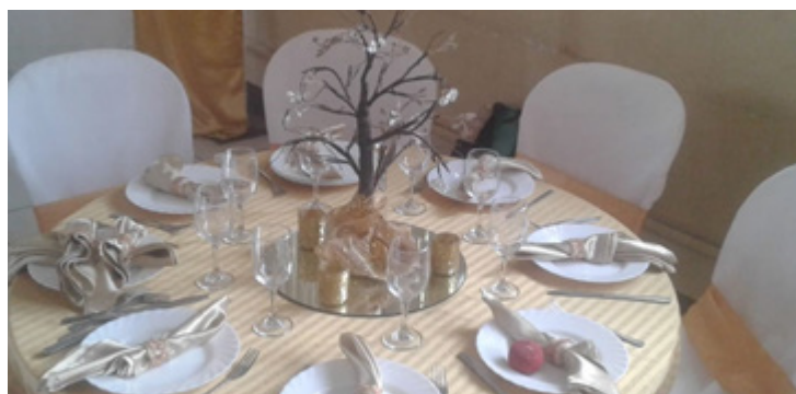
Demostración de creatividad en la organización de eventos.