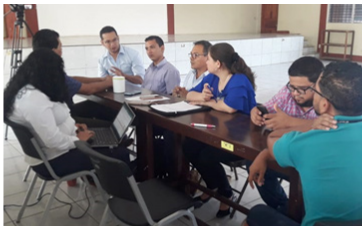
Docentes comparten experiencias en temas de innovación

Docentes del Departamento de Ciencias, Tecnología y Salud, participaron el 29 de abril del 2019 de un Grupo focal cuyo objetivo fue recopilar y sistematizar información, experiencia y matices sobre el trabajo en temas de Innovación realizado en la FAREM-Carazo en los últimos 20 años. Trabajo que está a cargo de la Dirección de Extensión Universitaria de UNAN-Managua.