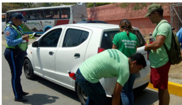
Jóvenes universitarios en sensibilización de Educación Vial

Esta jornada se realizó con el objetivo de sensibilizar a los veraneantes en la responsabilidad al conducir y además en que todos fuesen parte de mantener las playas limpias y seguras para promover más el turismo y las buenas prácticas saludables. Esta jornada se realizó en los alrededores de la rotonda La Boquita-Casares.