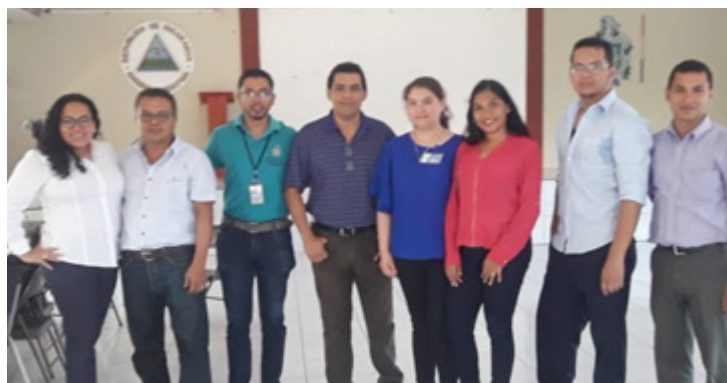
Representación del Dpto. Ciencias, Tecnología y Salud