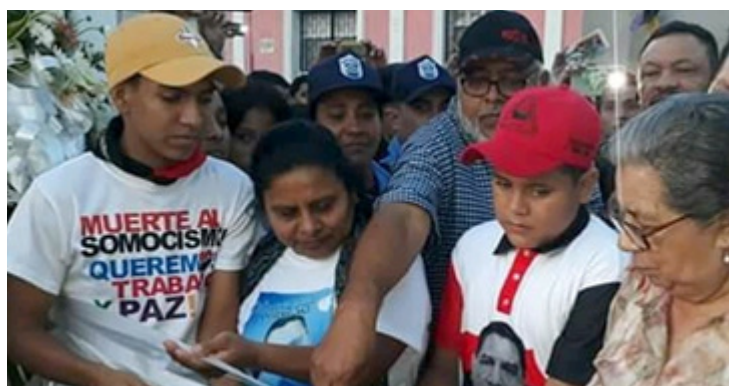
"Corte de cinta" inaugurando la reconstrucción del edificio