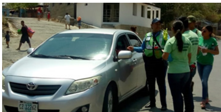
“Buenas prácticas ambientales” fue el mensaje de los jóvenes