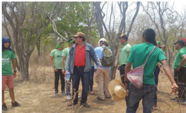
Estudiantes y especialistas ambientales culminan el recorrido

Esta actividad se realizó en la finca agro ecológica Tonantzin en la comunidad La Trinidad, municipio de Diriamba, con este tipo de actividades se pretende que los estudiantes entren en contacto y conozcan en el sitio sobre la flora y fauna existente en la Región, para crear mayores vínculos al cuidado y protección de la naturaleza.