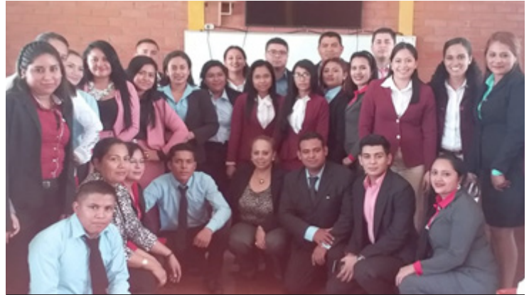
Foto grupal en celebración a un logro profesional más.

Estas defensas se realizaron los días 29 y 30 de abril de 2019, donde los estudiantes cumplieron satisfactoriamente con los requisitos, entre los trabajos presentados se destacan los planes de marketing a diferentes micro empresas, así como la elaboración de productos incursionando en el emprendedurismo.