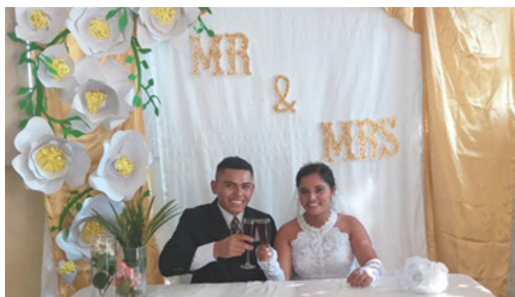
Puesta en escena de la organización y decoración de bodas

El objetivo de estas presentaciones es parte de la estrategia de enseñanza-aprendizaje, cuyo objetivo fue que los estudiantes pusieran en práctica los conocimientos teóricos sobre la organización y manejo de eventos sociales como bodas, quince años, bautizos, baby shower, entre otros.