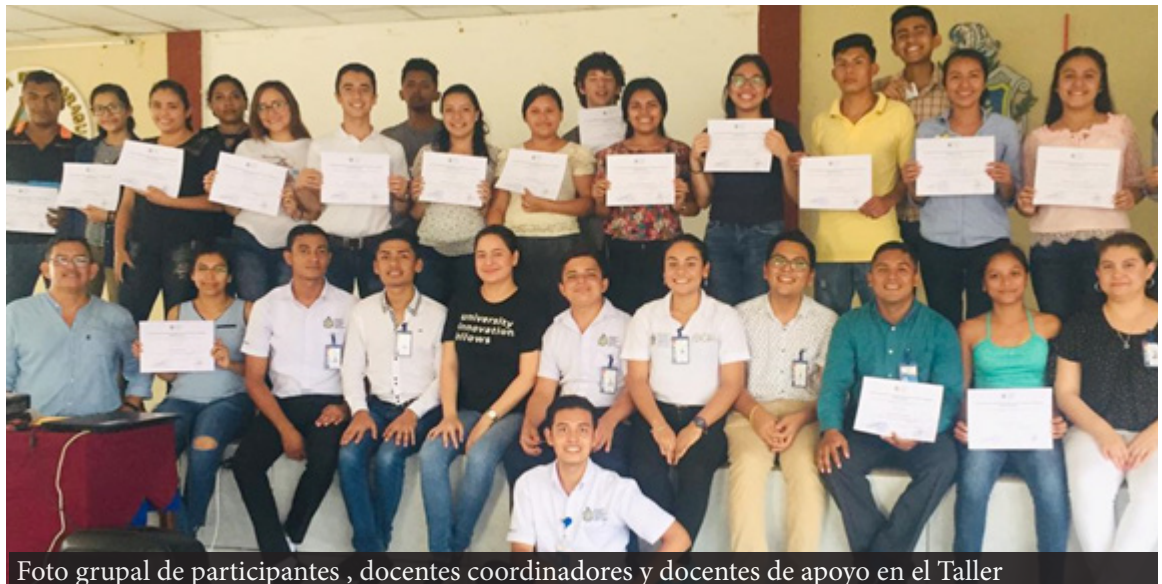
Foto grupal de participantes , docentes coordinadores y docentes de apoyo en el Taller

Por medio del Vicerrectorado de Investigación, Posgrado y Extensión Universitaria y la Dirección de Extensión Universitaria de UNAN-Managua, se realizó el 12 de abril del 2019 en el auditorio Eliseo Carranza de FAREM-Carazo, el “Taller de innovación mediante Design Thinking en base a la experiencia del programa de innovation Fellow de Stanford”.