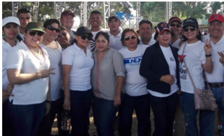
Comunidad de FAREM-Carazo conmemora al Cmdte. Borge

En esta caminata hubo el reencuentro de generaciones madres de mártires, sandinismo histórico, juventud, mujeres y hombres trabajadores que reafirmaron su respaldo al Frente Sandinista de Liberación Nacional.