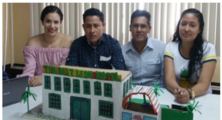
Las propuestas lograron los objetivos del proyecto académico